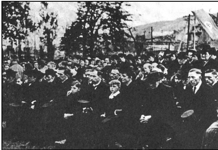
Trauerfeierlichkeiten für die Opfer des Angriffs