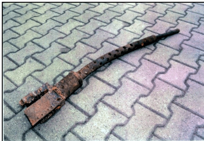
MG aus der "Our Baby".

Die Absturzstelle erreicht man über den erwähnten Fußweg, kurz nach Verlassen des Waldes. Sie befindet sich rechterhand, in der Niedermohrer Flur „Hinter dem Jungenbüsch“, an der Gemarkungsgrenze zu Nanzdietschweiler. Bis heute haben sich Gerüchte gehalten, in dem Bomber sei ein verkohltes Besatzungsmitglied gefunden worden. Doch dies trifft nicht zu, wie wir im folgenden sehen werden.