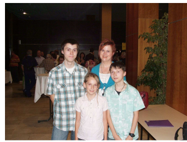
20. Mai 2009: Uraufführung der Dokumentation im Kinocenter Espace du Ried Brun in Muntzenheim in Frankreich