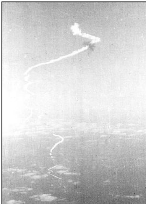
Die Rauchfahne zeigt die Spur der über Ramstein und Miesenbach abstürzenden Maschine.