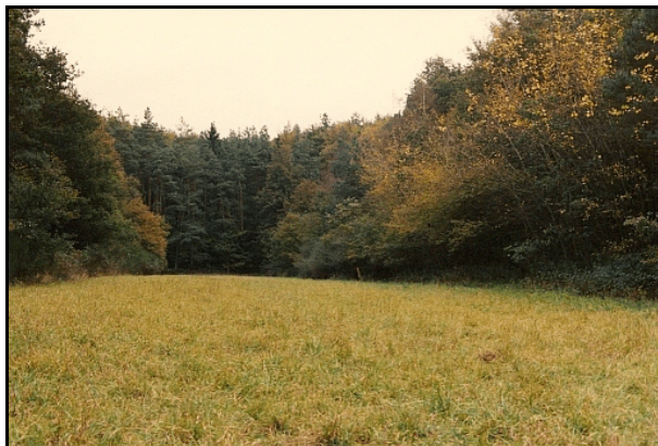
Die Absturzstelle bei Differten im Jahr 1997.